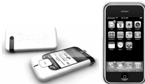
FIGURA 1.21 – O projecto Android da Google e o dispositivo iPhone da Apple